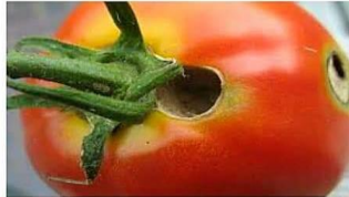
(دودة شمار الطماطم: مظاهر الإصابة على شمار الطماطم)