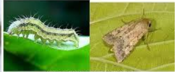
(دودة شمار الطماطم: الفراشة + اليرقات)